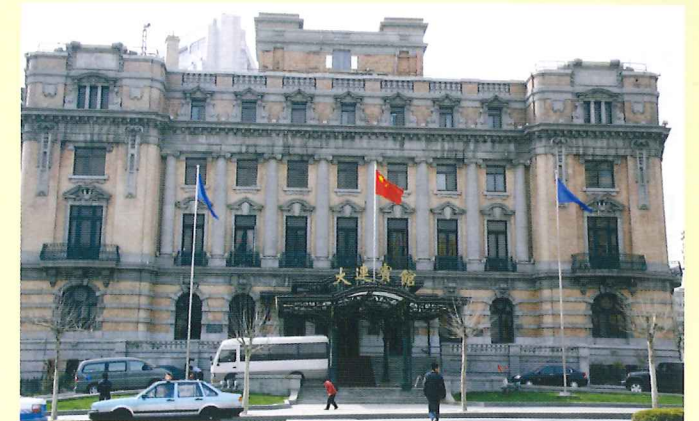
※中山広場にある大連賓館(旧ヤマトホテル)