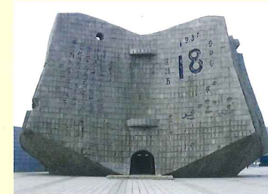
※九・一八歴史記念館

遼寧省の首都で、東北三省の中でも最も大きな都市のひとつです。人口は約700万人です。漢族を中心に29の少数民族が住んでいます。瀋陽は、元代に瀋陽と呼ばれましたが、女真族のヌルハチが後金を興した際には盛京と呼ばれ、日本支配時代には奉天となり、1945年にまた瀋陽という名称に戻りました。 18世紀以降は、帝政ロシア、日本の勢力下にはいり、最重要都市として発展を遂げ、中華人民共和国成立後は、重工業都市として発展を遂げました。 瀋陽には満州事変の発端となった柳条湖があり、現場近くには、現在九・一八歴史記念館があります。