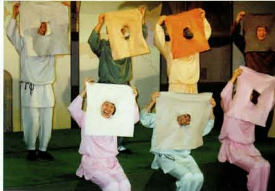
一枚のフェルト布が

シンプルプレイ=「素劇+ア・カペラ (オペレッタ) =アカペレッタ」+「フェルトプレイ (変身帽子)」